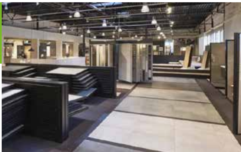
Impressie van de showroom

Voor openingstijden zie website: www.jangroentegels.nl