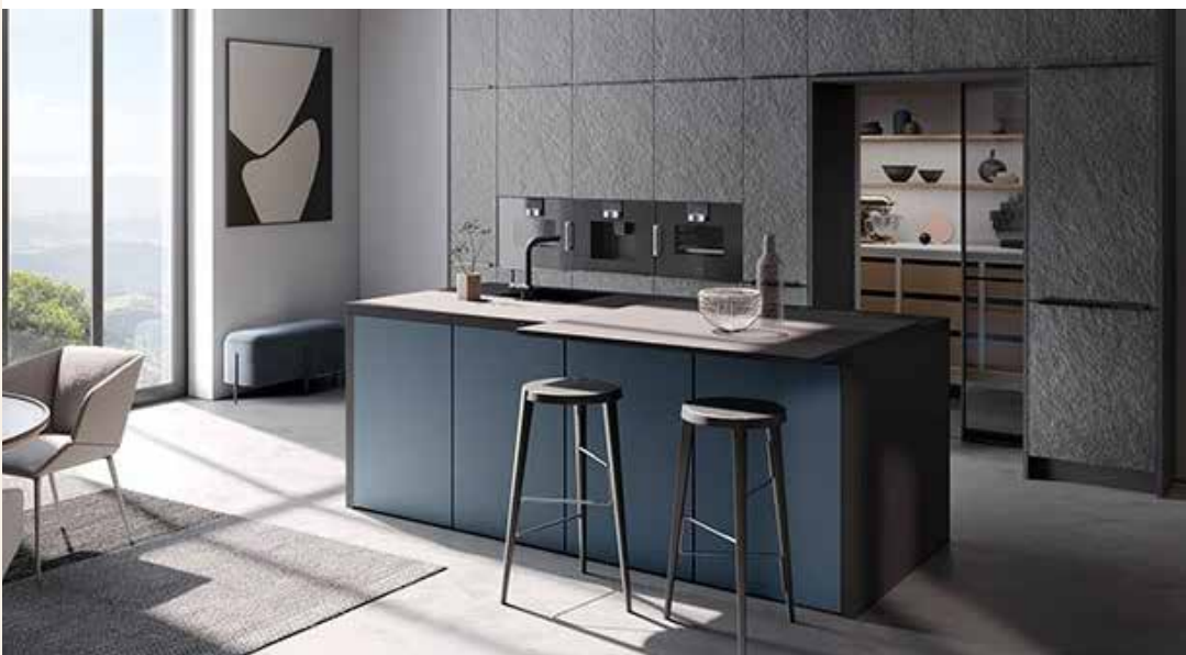
Sfeerbeeld Eigenhuis Keuken

Na de sluitingsdatum van een keuzelijst komt deze lijst automatisch te vervallen. Dit betekent dat de aangeboden opties en de bijbehorende prijzen vanaf dan niet meer van toepassing zijn. Indien je de woning hebt gekocht ná het verstrijken van een sluitingsdatum, wordt in overleg bepaald welke mogelijkheden er nog zijn. Je kunt jouw wensen dan kenbaar maken en, afhankelijk van de stand van de bouw c.q. de voorbereidingen, wordt bekeken of deze wensen nog mogelijk zijn. Indien dit het geval is ontvang je daarvoor dan een prijsopgave. Wanneer er extra kosten van toepassing zijn om jouw wensen nog mogelijk te kunnen maken dan zullen deze in die prijsopgave worden meegenomen.