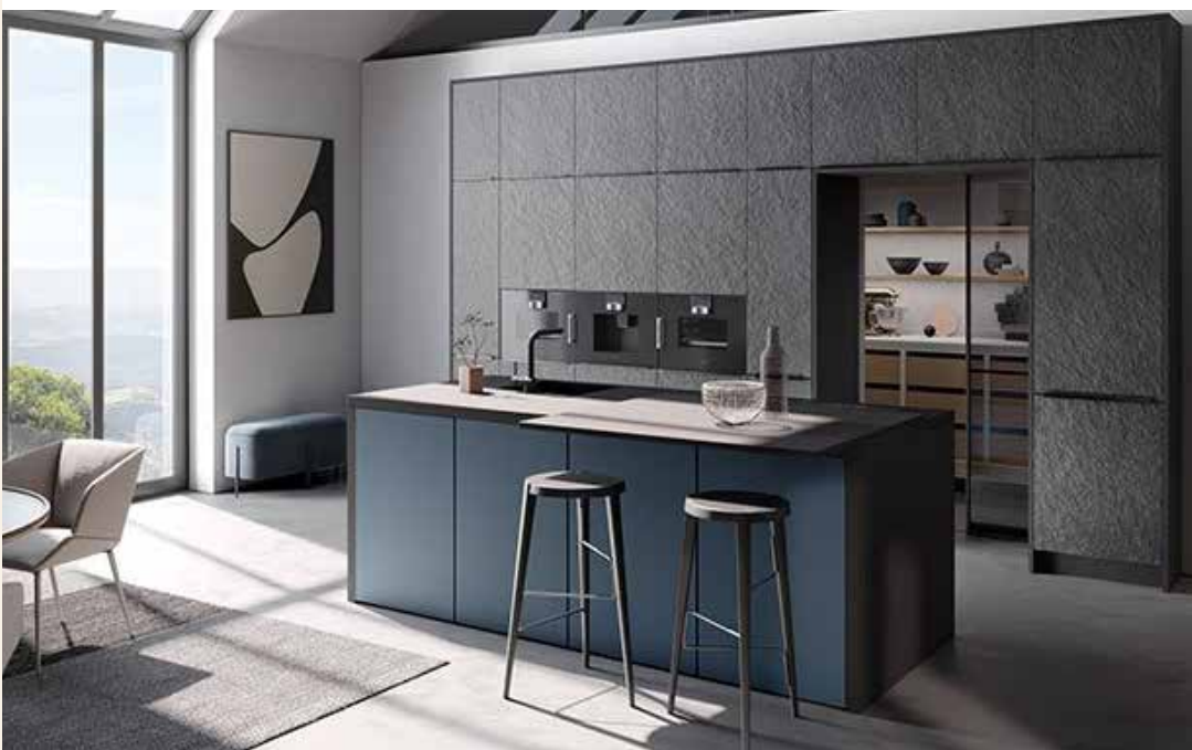
Sfeerbeeld Eigenhuis Keuken

Ook als je besluit om geen gebruik te maken van aangeboden opties verzoeken wij je dit aan te geven. Op die manier weten wij zeker dat je geen gebruik wilt maken van die aangeboden opties.